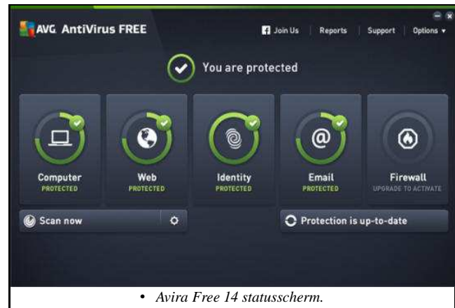
• Avira Free 14 statusscherm.

AVG Free werkt van Windows XP SP2 tot en met Windows 8.1. Er wordt aangeraden om minstens 1GB RAM in je PC te hebben. Dit programma werkt zowel met 32- als 64-bits versies van Windows.