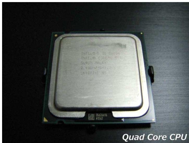
Intel Core 2 Quad Q6600 @ 2400MHz

Deze nieuwe processor zou de roepnaam Core meekrijgen. Waarvan in eerste instante een single-core (enkele CPU) onder naam Core Solo op de markt zou komen samen met een Dual-core (2 cpu's in 1 chip) onder de naam Core Duo. Dit tweetal zou het einde van de Dual-Core Pentium D betekenen. En daarmee dus ook het einde van de Netburst-architectuur. Hun sterkste troeven waren. Een veel lager energieverbruik ten opzichte van de Pentium 4-generatie en MEER snelheid met MINDER MHz! Deze processors werden later opgevolgd door modellen die een nog beter energieverbruik hadden, de huidige generatie Core 2-technologie.