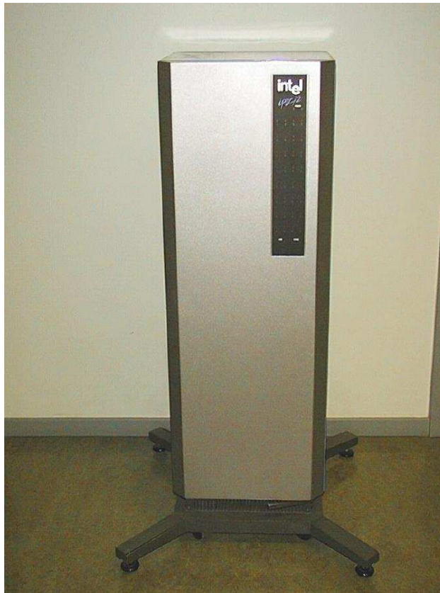
multi-processor systeem Intel iPSC/2 met 16 cpu's uit 1987.