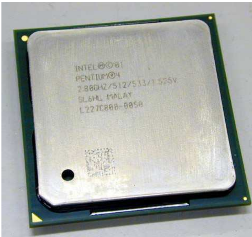
De Intel Pentium 4 cpu zonder Hyperthreading uit 2001

In deze nieuwsbrief lichten we vooral de ontwikkelingen van de Intel CPU toe dewelke voorkomt in de meeste PC's. Er zijn nog andere processors op de markt voor tal van andere computersystemen (zoals bv. de Sony playstation of de oudere generatie Apple MacIntosh). Zelfs op de PC-markt zijn er processors die volledig compatible zijn met die Intel CPU. Voornamelijk van het concurrerende merk AMD (welke ontstaan is uit ex-Intel medewerkers). Deze hebben hun eigen ontwikkelingen doorgemaakt welke nu niet ter sprake komen.